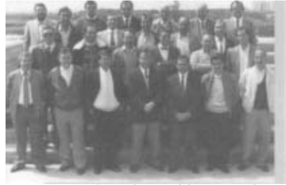
Antiguos alumnos del centro en el 25 aniversario de la 1ª Promoción

Este desarrollo será tan grande que el departamento desdobra a finales del curso pasado el centro, dando origen al IES «Valle del Ebro» y retornando la ETI a sus orígenes, convirtiéndose de